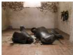
Den nedstyrtede kirkeklokke